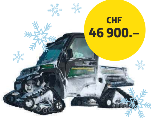
XUV835M mit Raupen Benzin

Symbolbild – tatsächliche Paket-Ausstattung kann vom Bild abweichen. Preisänderungen und Irrtum vorbehalten. Nur solange Vorrat. Alle Preise in CHF, inkl. MwSt. Gültig bis 31. Oktober 2021.